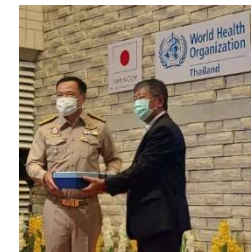
国立衛生研究所改修記念式典 (6/21)