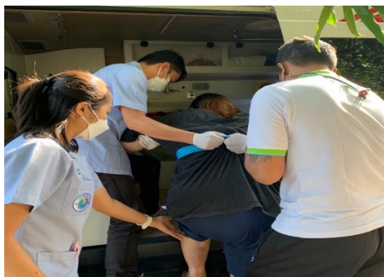
現車両での送迎の様子