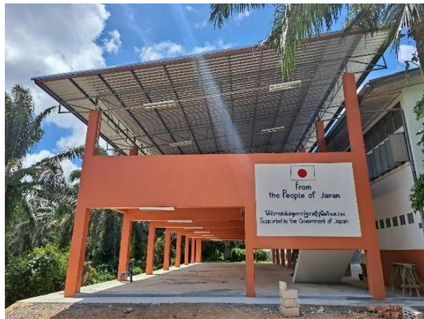
ศูนย์อพยพที่ก่อสร้างแล้วเสร็จ