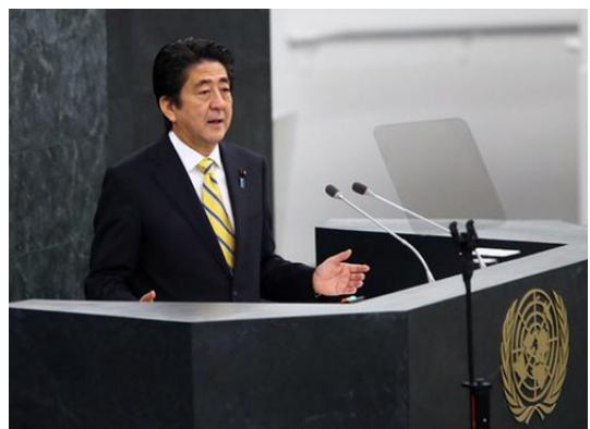
ฯพณฯ นายชินโซ อาเบะ กล่าว ณ ที่ประชุมสมัชชาใหญ่

ในส่วนตัวแรกได้กล่าวถึง “Abenomics” ไปแล้ว แต่สำหรับคำว่า “Womenomics” พอจะรู้จักกันบ้างไหมครับ นั่นก็คือ การตระหนักถึงความสำคัญในการส่งเสริมให้ผู้หญิงญี่ปุ่นก้าวขึ้นมาข้างหน้าในสังคมอย่างเป็นรูปธรรม ซึ่งจะทำให้อัตราการเติบโตทางเศรษฐกิจสูงขึ้น ในปัจจุบันรัฐบาลของ ฯพณฯ นายชินโซ อาเบะ นายกรัฐมนตรีญี่ปุ่นได้ดำเนินนโยบายซึ่งให้ความสำคัญเรื่อง “การสร้างสังคมที่บทบาทของสตรีเปล่งประกาย” โดยดำเนินการตามหลักของ