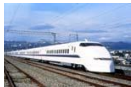
รถไฟความเร็วสูง "ชินคันเซน"

การแข่งขันโอลิมปิกเกมส์ ณ กรุงโตเกียวเคยจัดขึ้นในปี ค.ศ. 1964 ซึ่งเป็นระยะเวลาที่ประเทศญี่ปุ่นเติบโตอย่างมาก ในช่วงเวลานั้นซึ่งตรงกับการจัดการแข่งขันโอลิมปิกเกมส์ รถไฟความเร็วสูงชินคันเซนระหว่างโตเกียว-โอซาก้าได้เปิดให้บริการด้วยเช่นกัน หลังจากนั้นรถไฟความเร็วสูงชินคันเซนได้ขยายเครือข่ายออกไปทั่วประเทศ