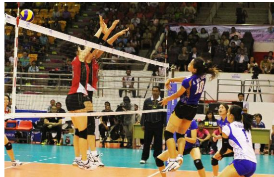
การแข่งขันวอลเลย์บอลหญิงชิงชนะเลิศแห่งเอเชียครั้งที่ 17

ความสัมพันธ์ระหว่างประเทศไทยและประเทศญี่ปุ่นแน่นแฟ้นต่อกันเสมอมา ในช่วงไม่กี่เดือนมานี้ได้มีการแลกเปลี่ยนความสัมพันธ์ที่มีความสำคัญอย่างยิ่งหลายประการจนนับไม่ถ้วน ในฐานะของเอกอัครราชทูตญี่ปุ่น ผมควรจะเริ่มต้นพูดถึงการแลกเปลี่ยนความสัมพันธ์ในระดับสูง ดังเช่น ทางด้านการเมืองใช่ไหมครับ หากแต่เรื่องเหล่านั้นมีอยู่มากมาย และโดยส่วนตัวแล้วผมเป็นแฟนกีฬา ผมจึงขอเริ่มเรื่องที่ผมมีความประทับใจที่สุดก่อนครับ