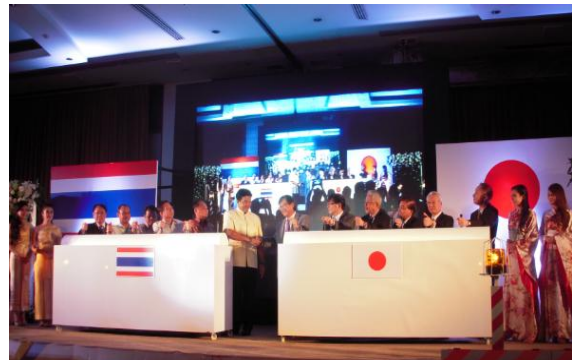
พิธีวางศิลาฤกษ์การก่อสร้างการยกระดับถนนวงแหวน รอบนอกด้านตะวันออกของกรุงเทพมหานคร

สำหรับผมซึ่งมาตำแหน่งในประเทศไทยยังไม่ทันจะครบหนึ่งปี จึงถือว่าทุกๆวันเป็นประสบการณ์ใหม่ ซึ่งในตอนนี้ก็เพิ่งจะได้รับประสบการณ์หน้าฤดูในไทย เป็นครั้งแรก แน่แน่นอนว่าเรื่องที่สนใจนั้นก็ต้องเป็นเรื่อง ของความเสียหายจากน้ำท่วม ภาพของความเสียหาย จากน้ำท่วมนั้นได้เห็นในรายงานข่าวทุกวันซึ่งทำให้ รู้สึกหดหูใจ ท่ามกลางสภาวะนี้ ทางรัฐบาลญี่ปุ่นเองก็ ได้ให้ความร่วมมือต่อ โครงการรับมือป้องกันน้ำท่วมหลายโครงการ เมื่อเดือนที่แล้ว ผมได้ไปร่วมพิธี วางศิลาฤกษ์การก่อสร้างการยกระดับถนนวงแหวน รอบนอกด้านตะวันออกของกรุงเทพมหานคร ซึ่งมีรัฐมนตรีกระทรวงคมนาคมเป็นประธาน นอกจากนี้ ยังได้ เริ่มโครงการก่อสร้างติดตั้งประตูระบายน้ำในอยุธยาอีกด้วย โครงการเหล่านี้ล้วนเป็นโครงการใหญ่ที่ไม่ สามารถทำให้เสร็จสมบูรณ์ได้ในทันที ผมเชื่อมั่นว่าจะเป็นเรื่องที่มีประโยชน์ต่อการป้องกันความเสียหายที่ เกิดจากน้ำท่วมจากนี้ต่อไป